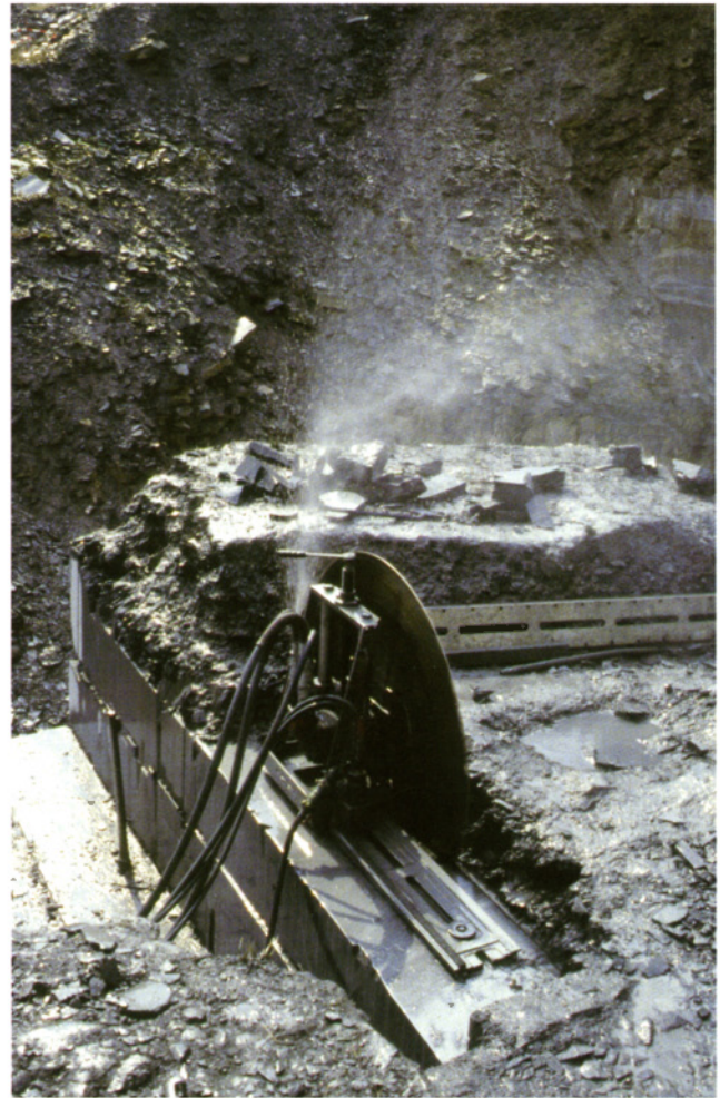
Abb. 3 Sägen der Säulen mit selbstfahrender hydraulischer Betonsäge

Als Ergebnis gut sechsjähriger Forschung konnte im letzten Jahr ein neues, diesmal gut belegtes Bild des Ablagerungsraumes gezeichnet werden.