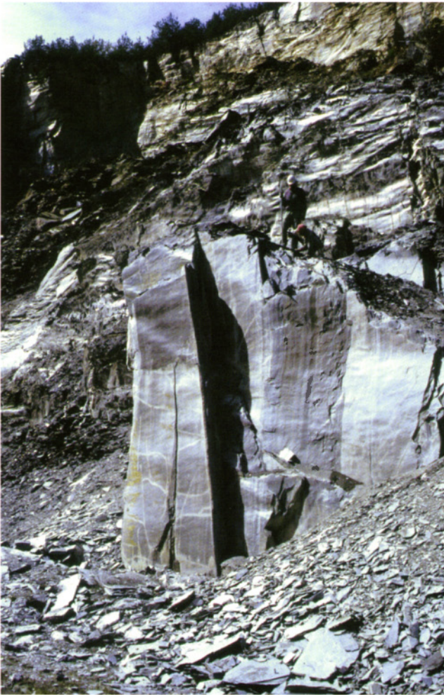
Abb. 2 Schiefersporn im Tagebau Eschenbach-Bocksberg in Bundenbach